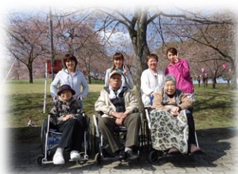
お天気にも恵まれ、つがの里に行ってきました！